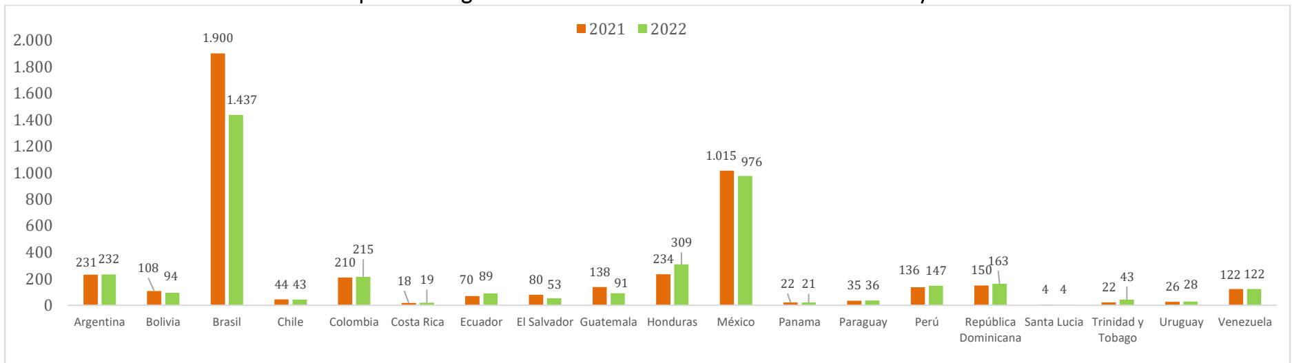
Gráfico No. 3 Comparativo regional de número de víctimas de femicidio 2021 y 2022