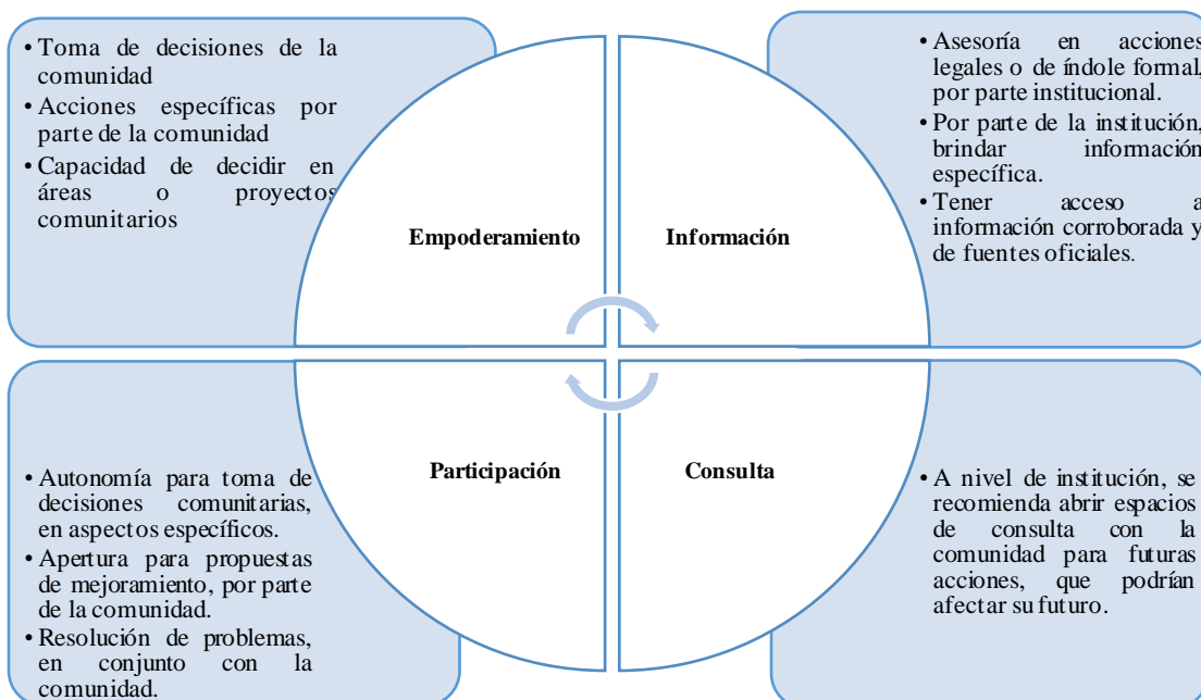
Gráfico 3. Conformación de redes de apoyo

Para lograr estas metas, se propone el trabajo desde el equipo técnico de la Casa de acogida, en las siguientes áreas.