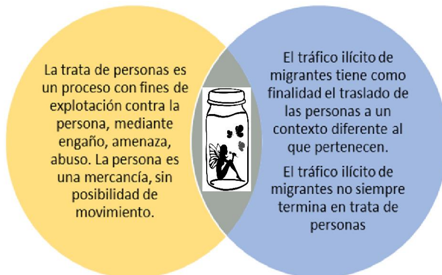
Gráfico 1. Trata de Personas y Tráfico Ilícito de Migrantes