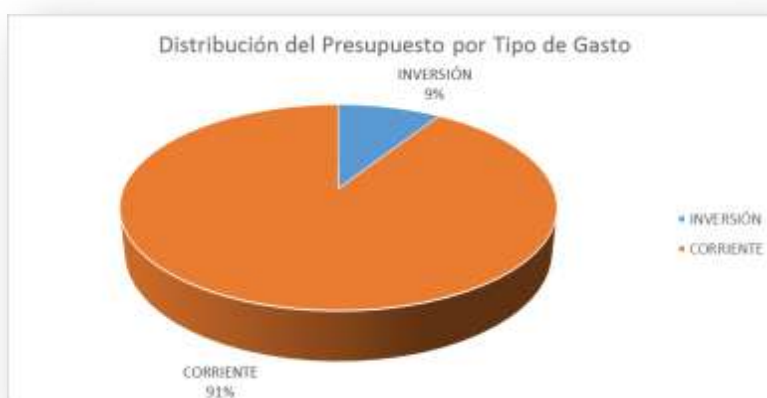
Gráfico N° 1: Distribución del presupuesto por tipo de Gasto 2021