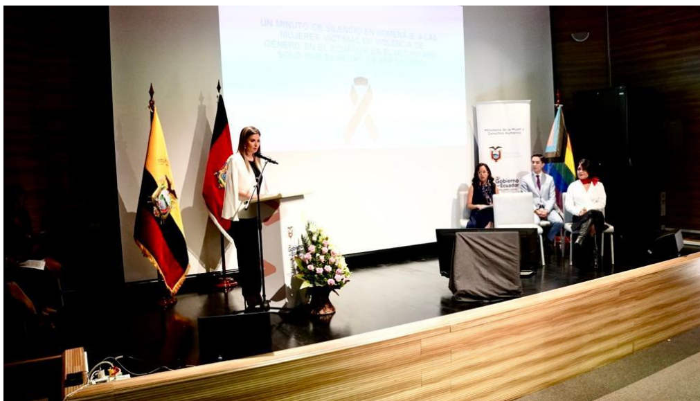
Gráfica 1: Momentos en que la ministra Paola Flores presenta el informe de Rendición de Cuentas, correspondiente a la gestión 2022.

Al iniciar su intervención, la ministra Paola Flores solicitó un minuto de silencio en homenaje a todas las mujeres asesinadas en el Ecuador en el último año.