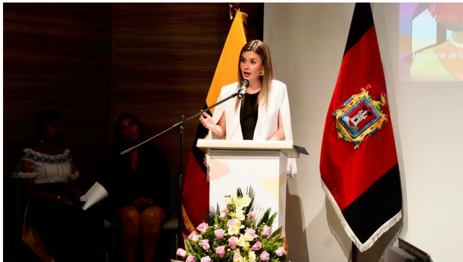
Gráfica 2: La ministra Paola Flores presenta el informe de Rendición de Cuentas de la gestión 2022.

Asimismo, afirmó que por primera vez “tenemos un Plan de Diversidades para que todas y todos reciban el lugar que merecen en la sociedad, se respeten sus derechos y vivan libres de toda forma de discriminación”.