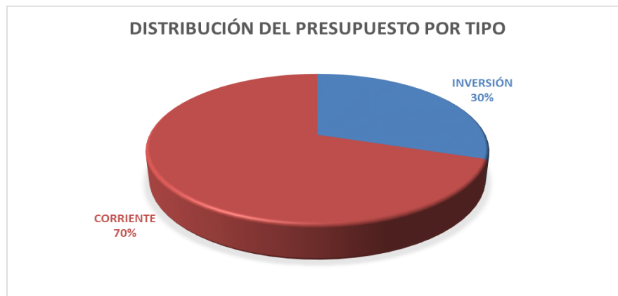
Gráfico N° 1: Distribución del presupuesto por tipo de Gasto 2022